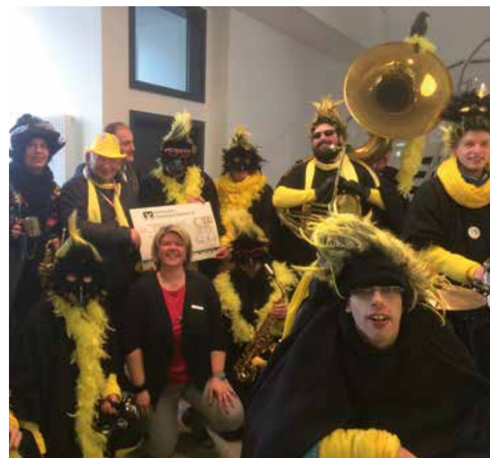
Über einen Spendenscheck in Höhe von 500,- € durfte sich der Gesang- und Musikverein Stimpfach am Gumpendonnerstag freuen.